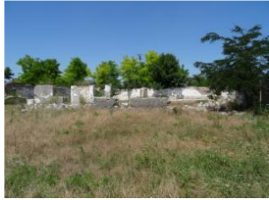
C3 – Atelier mecanic