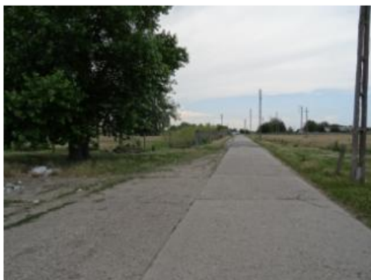
Drum de acces

Accesul în zonă se realizează pe străzi asfaltate.