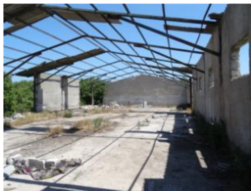
C1 - Depozit îngrășăminte