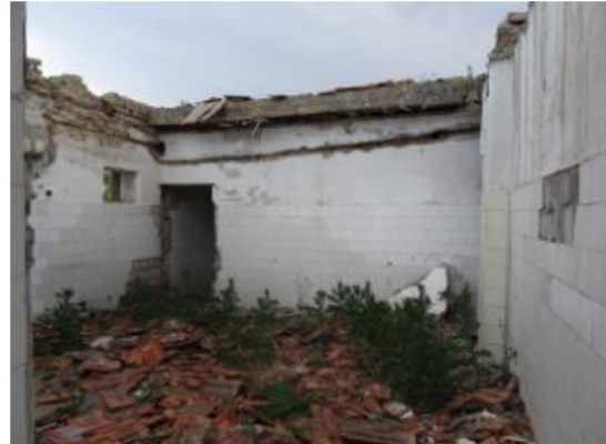
C6 - Cantina