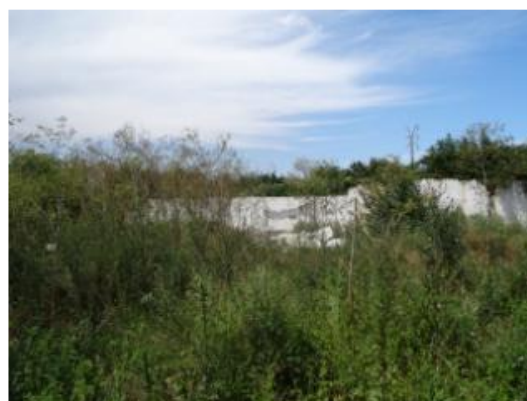
C2 – Magazie materiale