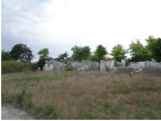
C3 – Atelier mecanic