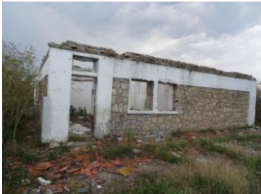
C6 - Cantina