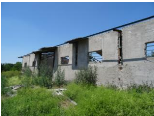
C1 - Depozit îngrășăminte