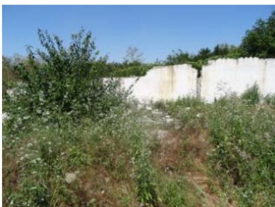
C2 – Magazie materiale